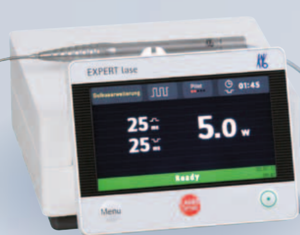
KaVo EXPERT Series