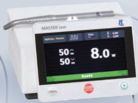
KaVo MASTER Series