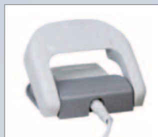
Commande au pied KaVo EXPERT lase

Outre le fait qu'il s'agisse de la méthode la plus confortable et la plus moderne pour effectuer des interventions mini-invasives, KaVo MASTER lase et KaVo EXPERT lase vous convaincront par un excellent rapport qualité-prix et le service fiable de KaVo. Le laser à diode de KaVo participera à l'image de votre cabinet par une méthode moderne avec des résultats améliorés pour vous et vos patients.